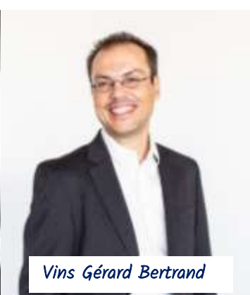
Vins Gérard Bertrand