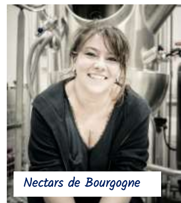
Nectars de Bourgogne