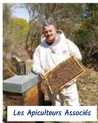
Les Apiculteurs Associés

Découvrir la carte de France des PME+ et leurs bonnes pratiques