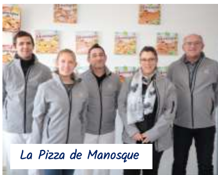
La Pizza de Manosque