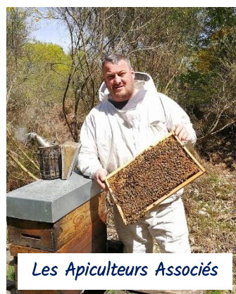
Les Apiculteurs Associés

Rencontre avec les PME+ Petit déjeuner presse, mars 2019